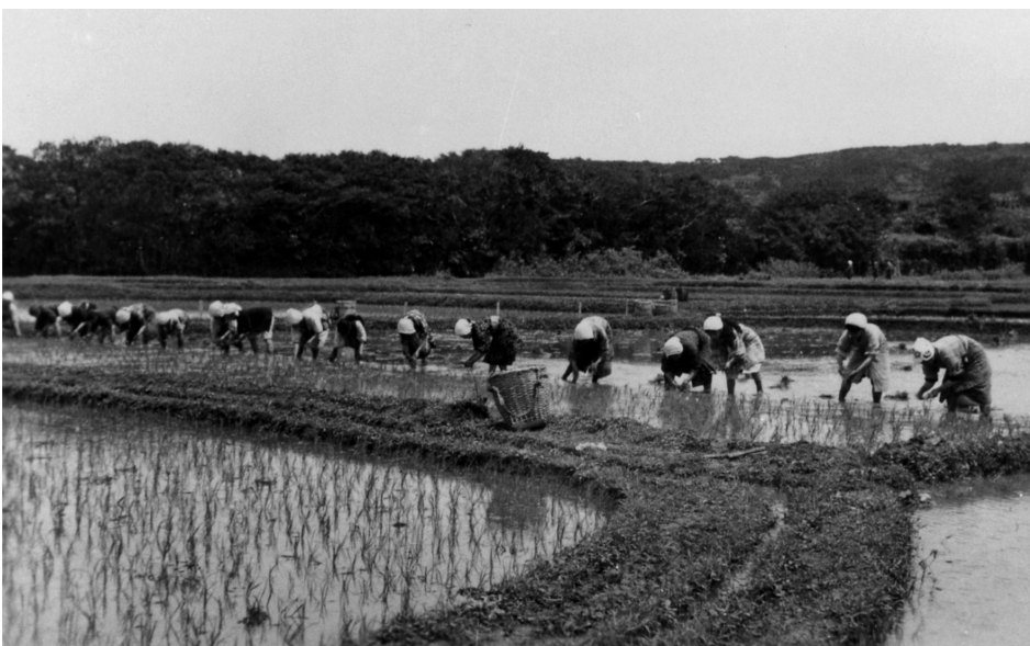
写真60 田植 於中間村 昭 11.4.26 [目録番号:ア-8-33]