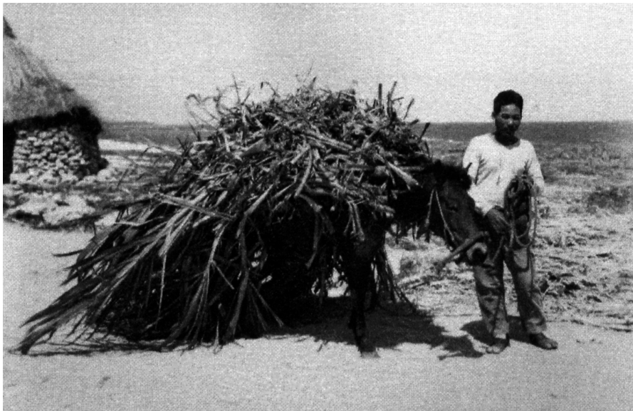
写真88 砂糖黍運搬（其の二） [目録番号：写真類1-14-35]