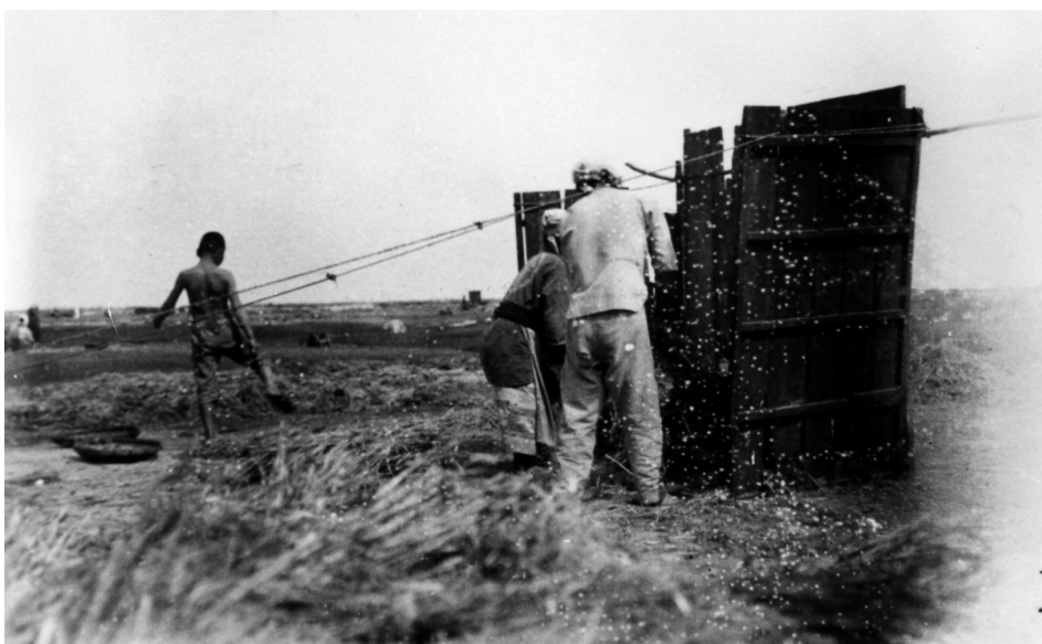
写真80 麦扱 (mugi a'kkai) 雑 穀機を用う 於早町村志戸桶 昭 和十一年五月七日 [目録番号：ア-3-15]