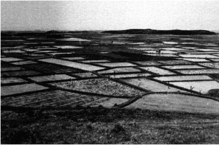
写真49 川嶺田圃 昭11.4.7 [目録番号：写真類1-14-31]