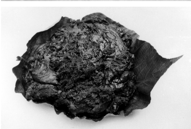
写真98 砂糖のお初 黒砂糖の初物を ユナの木の子の葉に盛り近所親戚に配る [目録番号：ア-5-23]