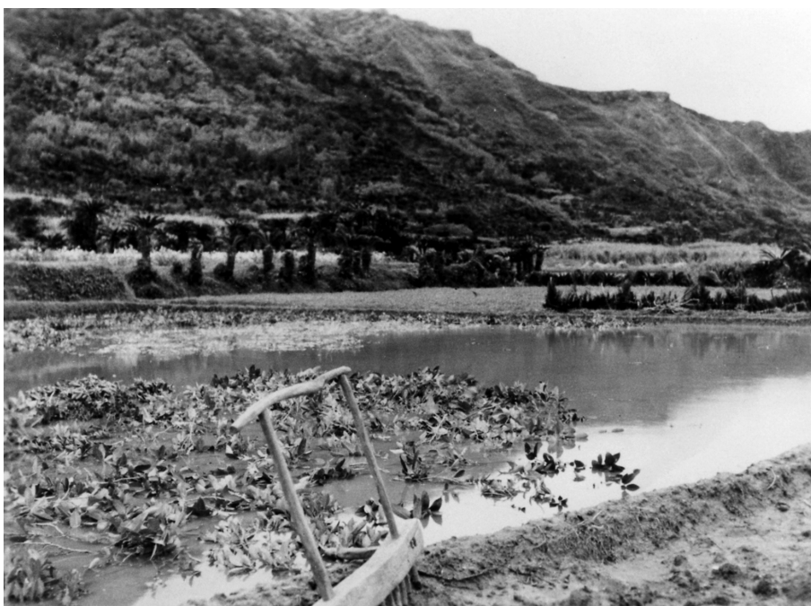
写真57 田のこやし マー 昭11.3 阿伝 [目録番号：ア-8-16]

※なお、「マー」とは写真中央の馬鋤を指す旨の説明が写真外に矢印を付して台紙にある。