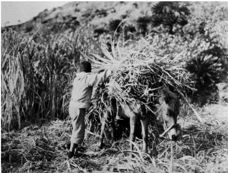
写真83 甘蔗運搬 昭11.3 阿伝 [目録番号：ア-8-3]