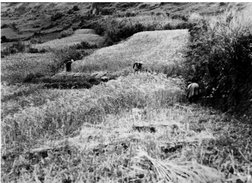
写真75 麦刈 於伊砂村 昭11.4.26 [目録番号：ア-8-51]