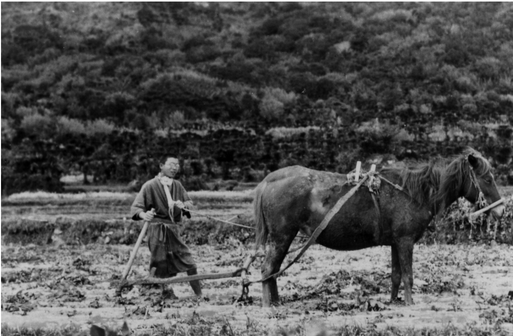
写真59 田のワク 昭 11.3 阿伝 [目録番号:ア-8-19]