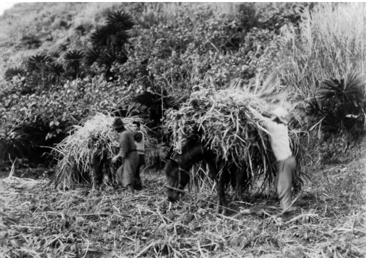
写真84 甘蔗運搬 昭11.3 阿伝 [目録番号：ア-8-4]