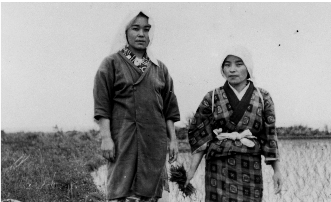
写真63 田植女 向かって左は島一番の歌者 (utasa: 歌の名人) ボッカ一氏 (於中間田圃) 昭11.4.26 [目録番号：ア-8-40]