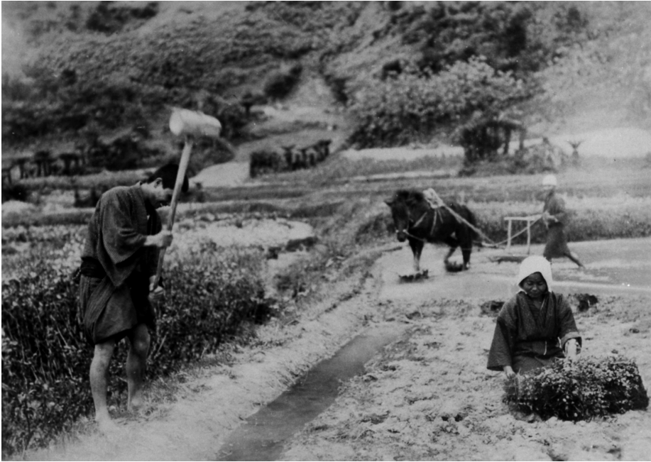
写真58 アブシ(畦)練り マー 入れ 蘇鉄刻み(肥料) 昭 11.3.27 阿伝 [目録番号:ア-8-15]