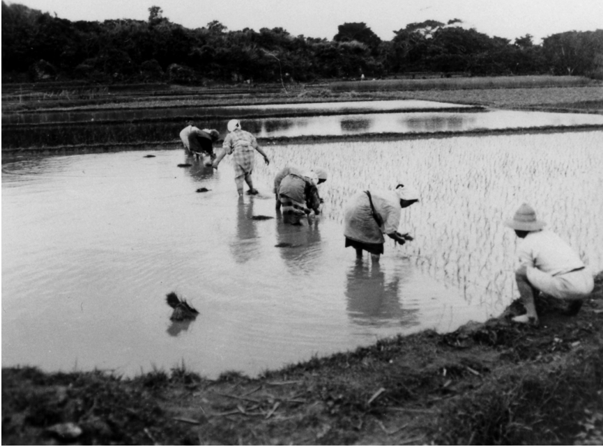
写真61 田植 於坂嶺田圃 昭11.4.26 [目録番号：ア-8-37]