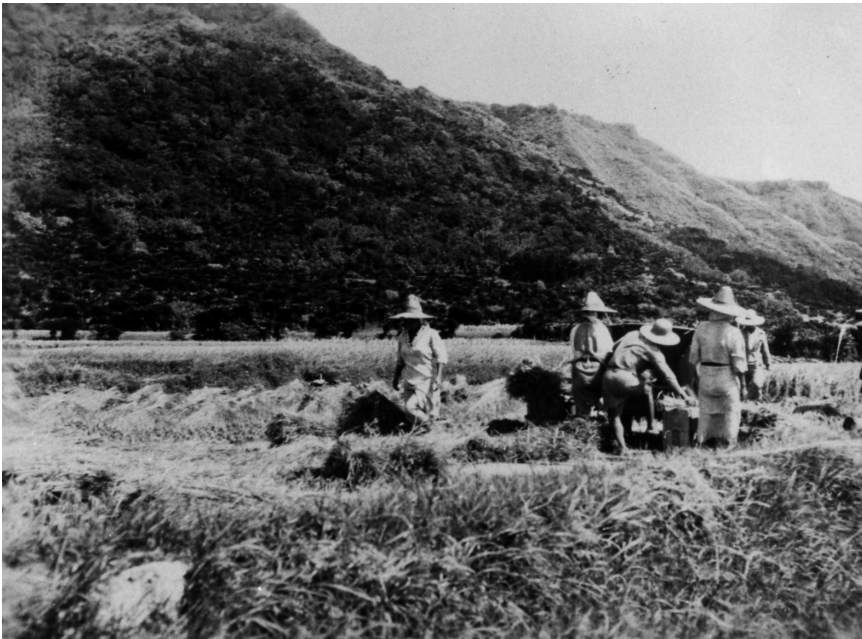
写真68 稲扱い 雑穀機にて 於阿伝昭11.8.3 [目録番号：ア-8-49]

※説明文のカッコ内の「岩倉作」とは岩倉市郎撮影を示す。「澁澤写真」の説明文には撮影者を示す際にしばしばこうした表記がみられる。