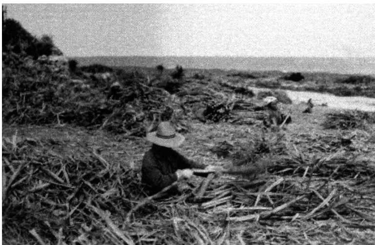
写真93 砂糖黍のはかま取り 於蒲生村 昭11.4 [目録番号：写真類1-14-26]