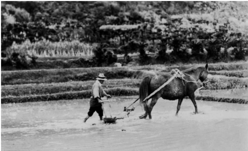
写真56 シルタ（しつけ終ろうとする田）のマー入れ [目録番号：ア-8-20]