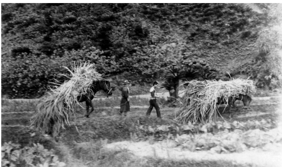
写真87 甘蔗運搬 昭11.3 阿伝 [目録番号：ア-8-7]