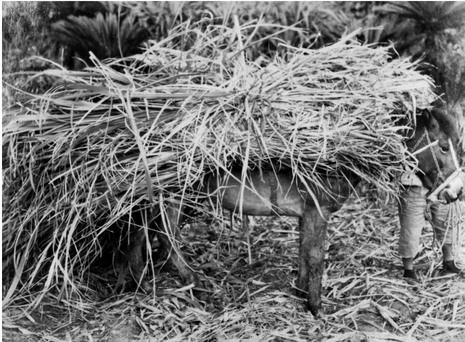
写真85 甘蔗運搬 昭11.3 阿伝 [目録番号：ア-8-5]