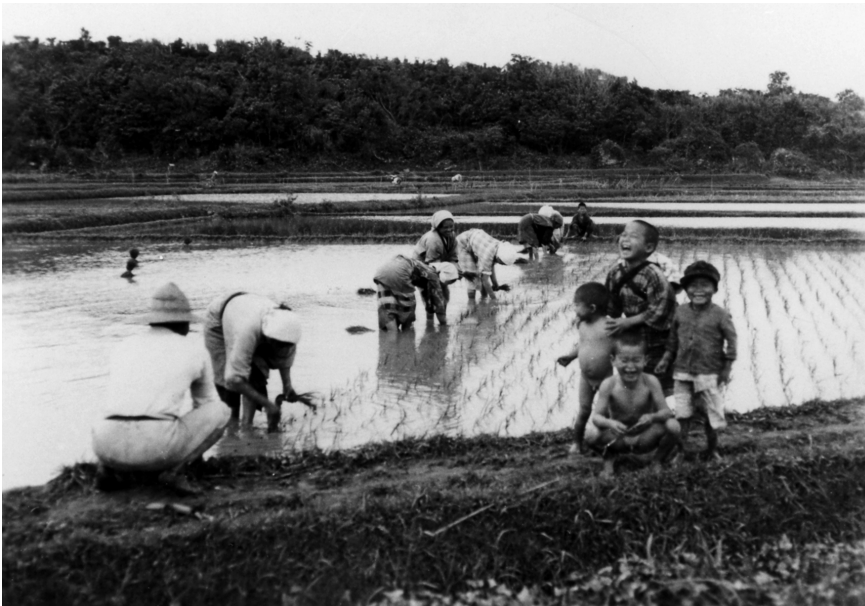
写真62 田植 於坂嶺 [目録番号：ア-8-39]