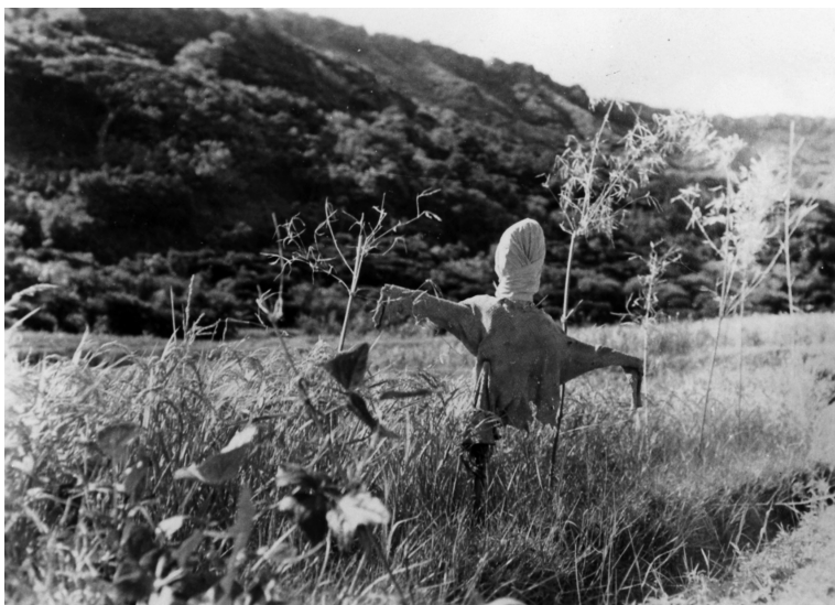
写真65 カガシ 於阿伝 昭11.7 [目録番号：ア-8-41]