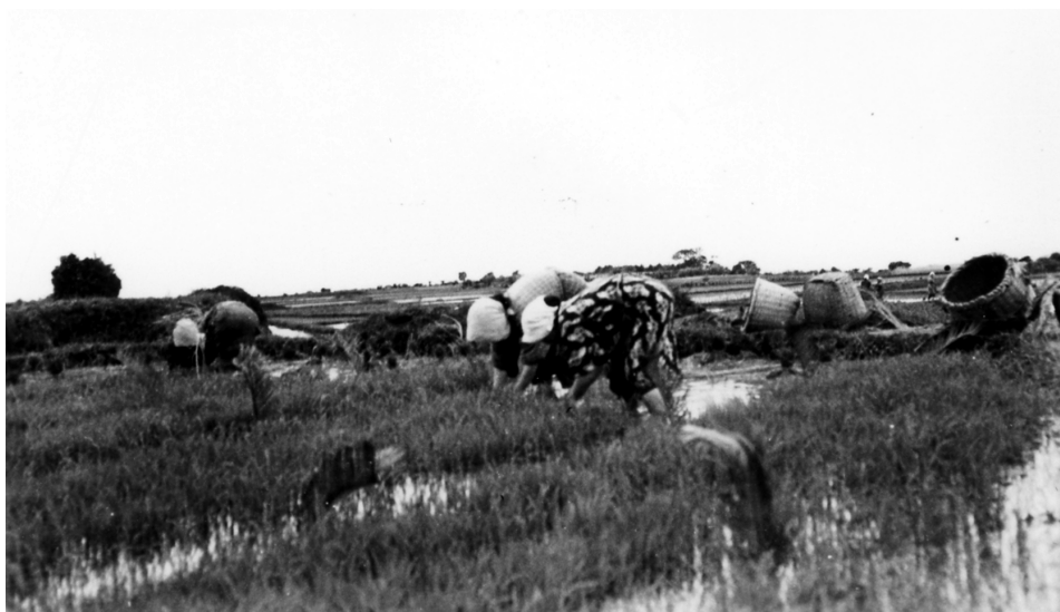
写真54 苗取り（於中間村）昭 11.4.26 [目録番号：ア-8-30]