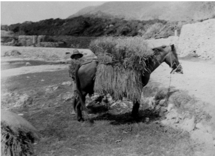
写真69 稲運び 於阿伝 昭11.8.1 [目録番号：ア-8-45]