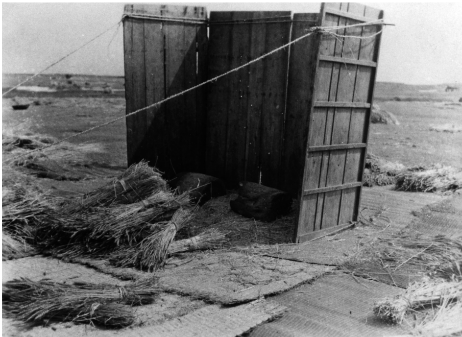
写真79 麦打場 早町村志戸桶 昭和11.5.7 [目録番号：ア-8-58]