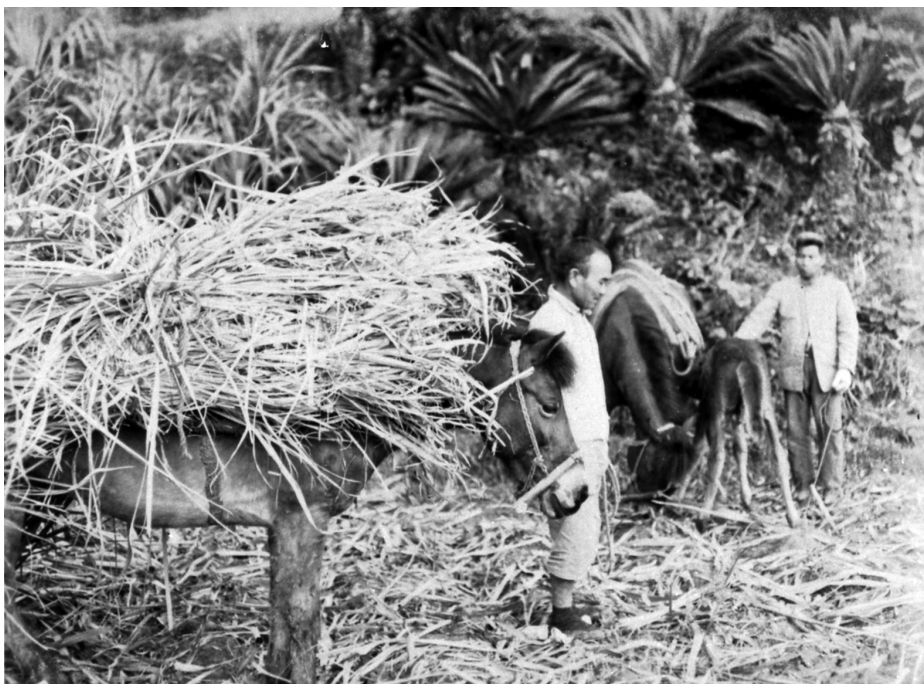
写真86 甘蔗運搬 昭11.3 阿伝 [目録番号：ア-8-6]