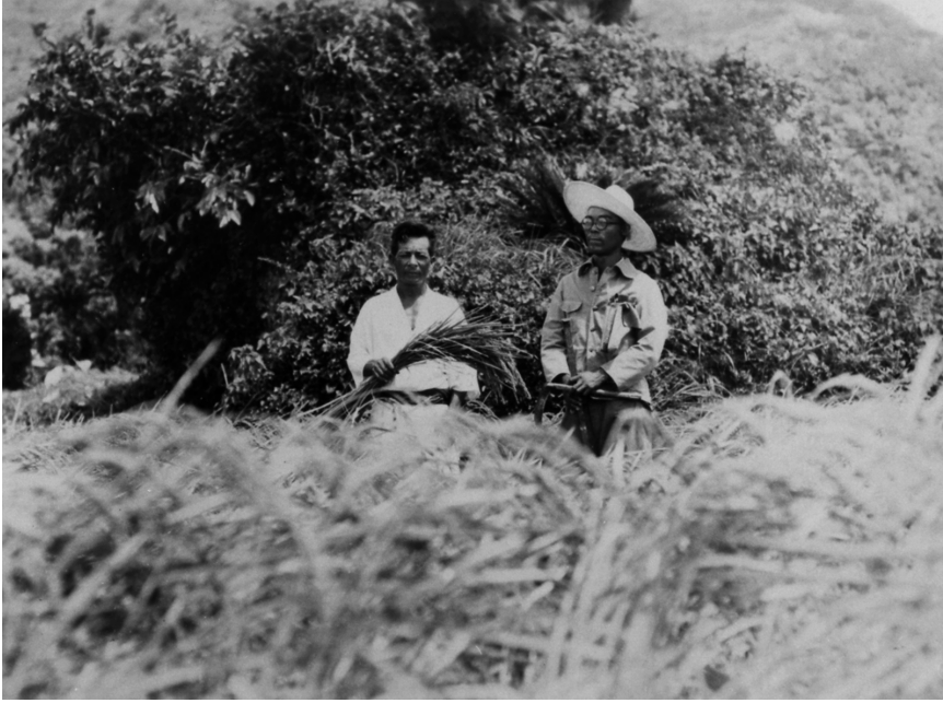
写真67 稲実る 新輸入奥羽一号（阿伝岩倉作）昭11.8.3 [目録番号：ア-8-44]

※説明文のカッコ内の「岩倉作」とは岩倉市郎撮影を示す。「澁澤写真」の説明文には撮影者を示す際にしばしばこうした表記がみられる。