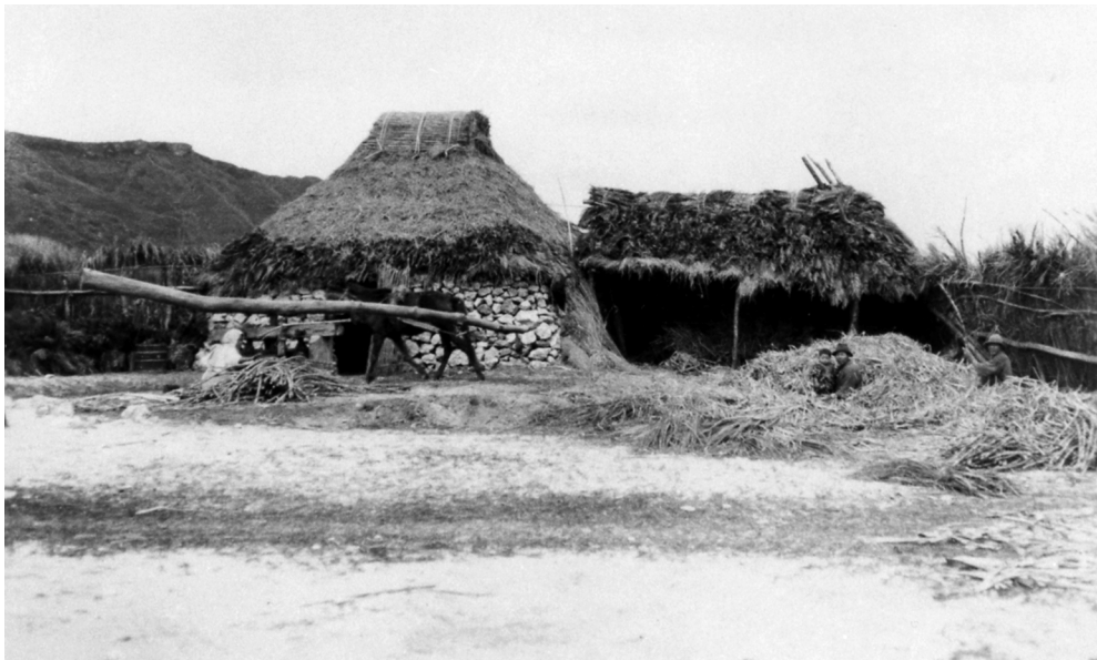
写真91 製糖場 昭11.3 阿伝 [目録番号：ア-8-8]