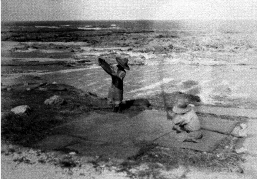
写真73 稲扱い [目録番号：写真類1-14-28]