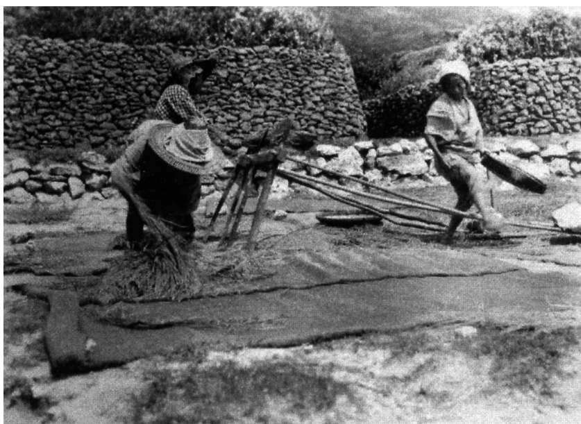
写真71 稲こぎ クダ（千歯）を用ふる例 昭11.8.1 於阿伝 [目録番号：写真類1-14-107]