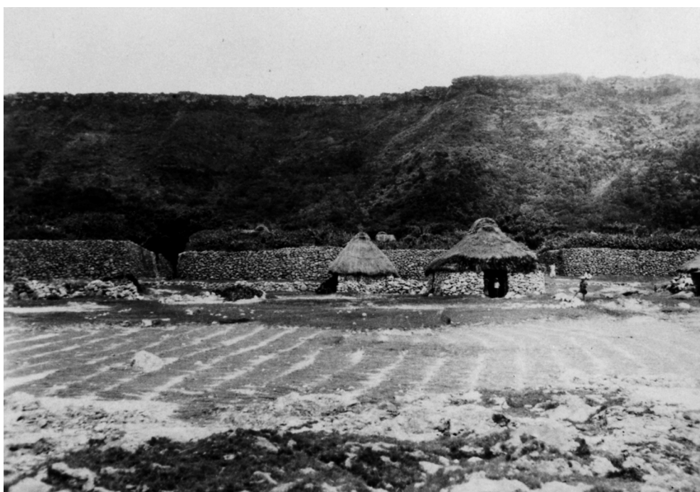
写真72 藁干 於阿伝 昭 11.8 [目録番号：ア-8-50]