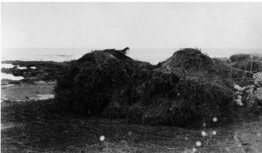
写真74 稲小積 於阿伝 昭11.8.1 [目録番号：ア-3-28]