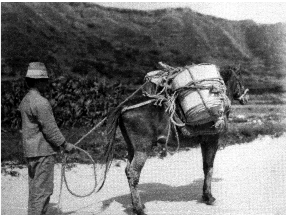
写真96 砂糖樽運搬 昭11.3 阿伝 [目録番号：写真類1-14-104]