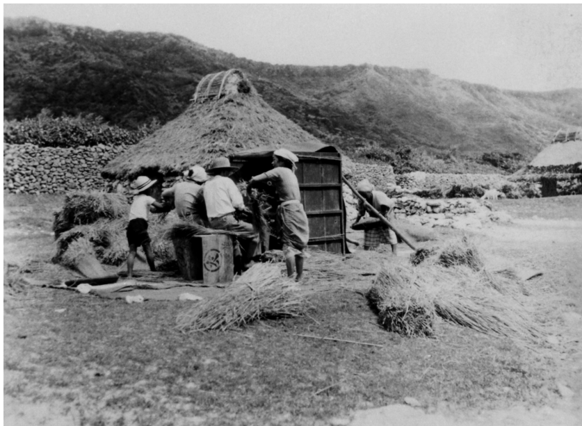
写真70 稲扱い 其ノ一 雑穀機にて 於阿伝 昭11.8.3 [目録番号：ア-8-47]