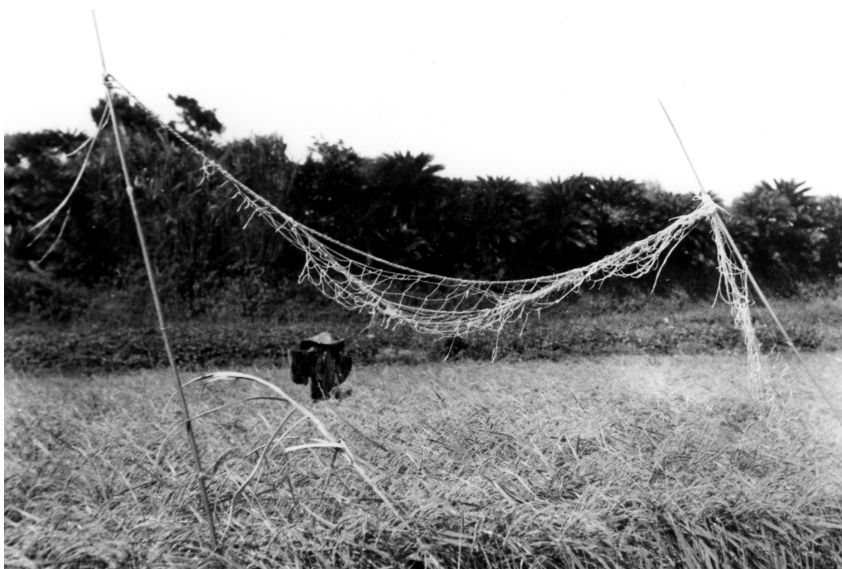
写真66 鳥追網（方言名なし） 於阿伝 昭11.7 [目録番号：ア-8-43]