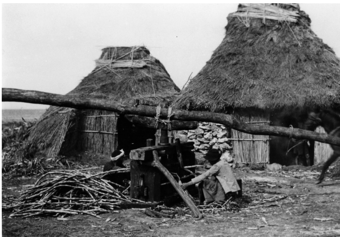
写真92 製糖場 喜界村坂峯 [目録番号：ア-8-9]