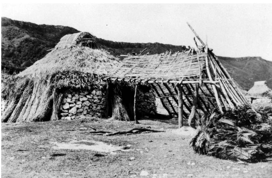
写真90 納屋 砂糖小屋？ [目録番号：ア-6-2]

※これはあきらかに阿伝の砂糖小屋である。説明文に？の記号が付せられているところから、この説明文を書いたのは撮影に関わった人間ではないことが推測できる。