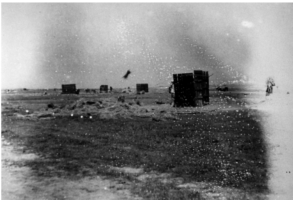
写真81 麦扱 於早町村志戸桶 昭和11年5月7日 [目録番号：ア-3-18]