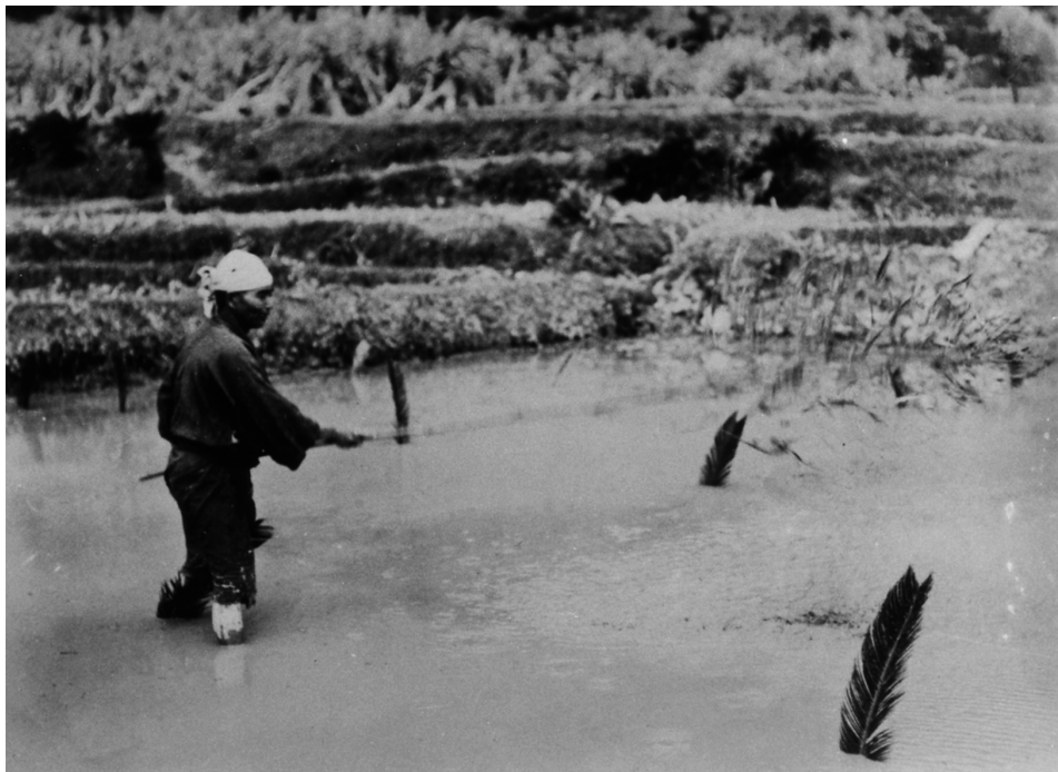
写真52 種打込 種を下 した後青竹の葉で種を叩く 昭11.3.27 阿伝 [目録番号：ア-8-27]