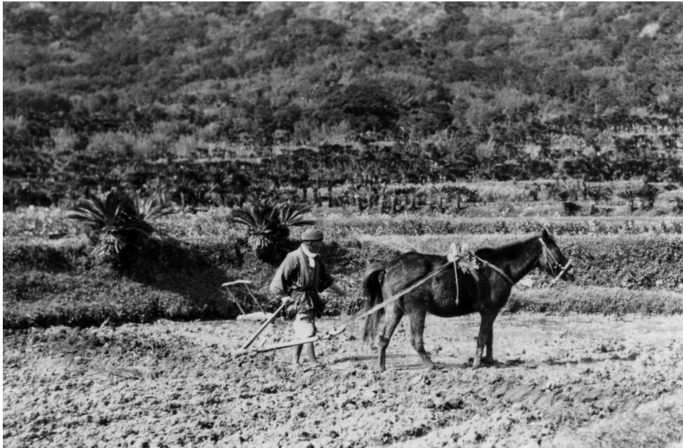
写真55 田のワク [目録番号：ア-8-14]