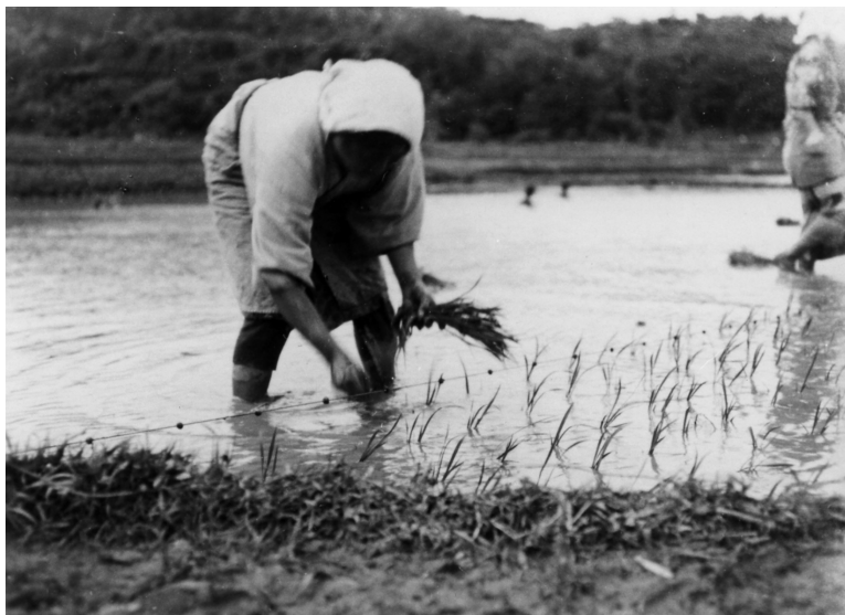
写真64 田植（於坂嶺田圃）昭11.4.26 [目録番号：ア-8-39]