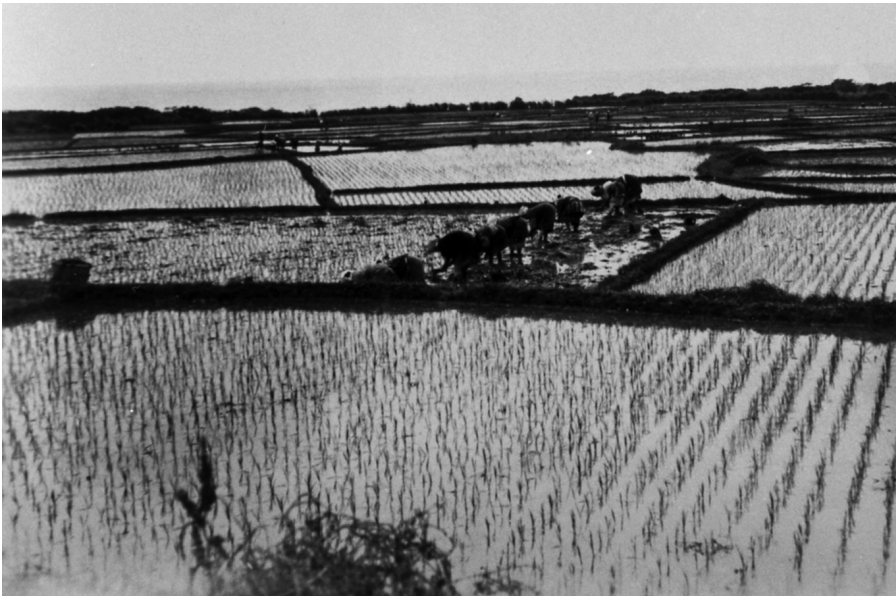
写真50 中間田圃 昭11.4.26 [目録番号：ア-3-17]