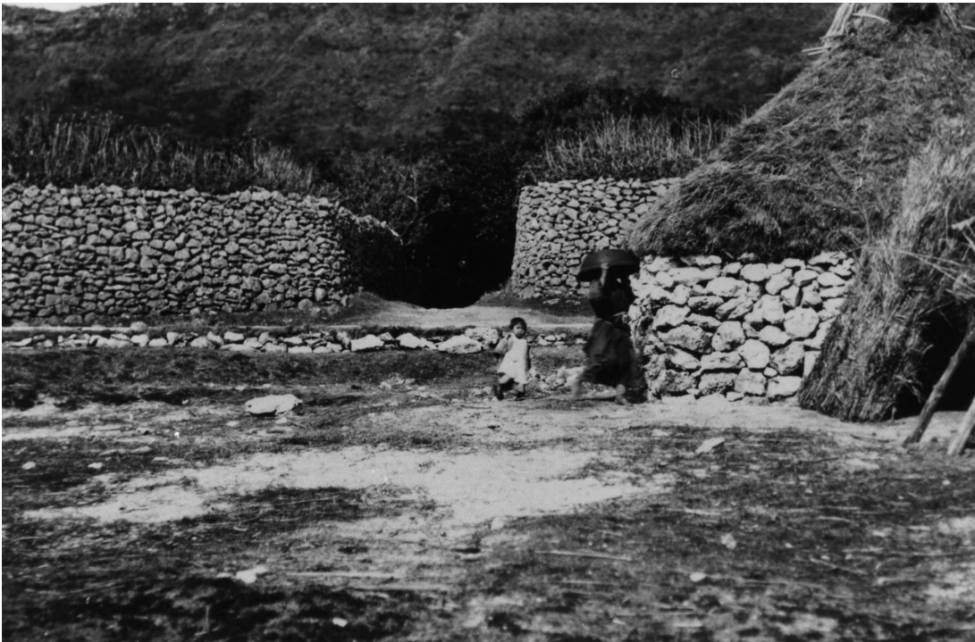
写真95 鍋を運ぶ女 [目録番号：ア-5-11]