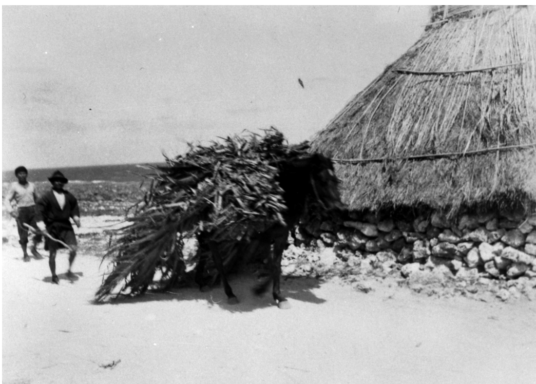
写真89 砂糖黍運搬 （其の一）於蒲生村 昭11.4. [目録番号：ア-3-25]