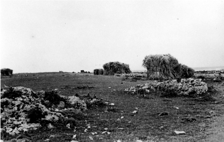
写真76 麦積（於中間村）昭 11.4.26 [目録番号：ア-8-54]