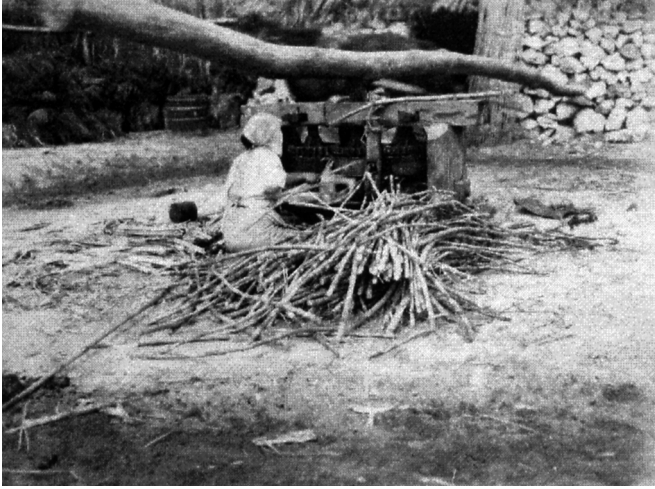
写真94 砂糖車 昭11.3 阿伝 [目録番号：写真類1-14-103]