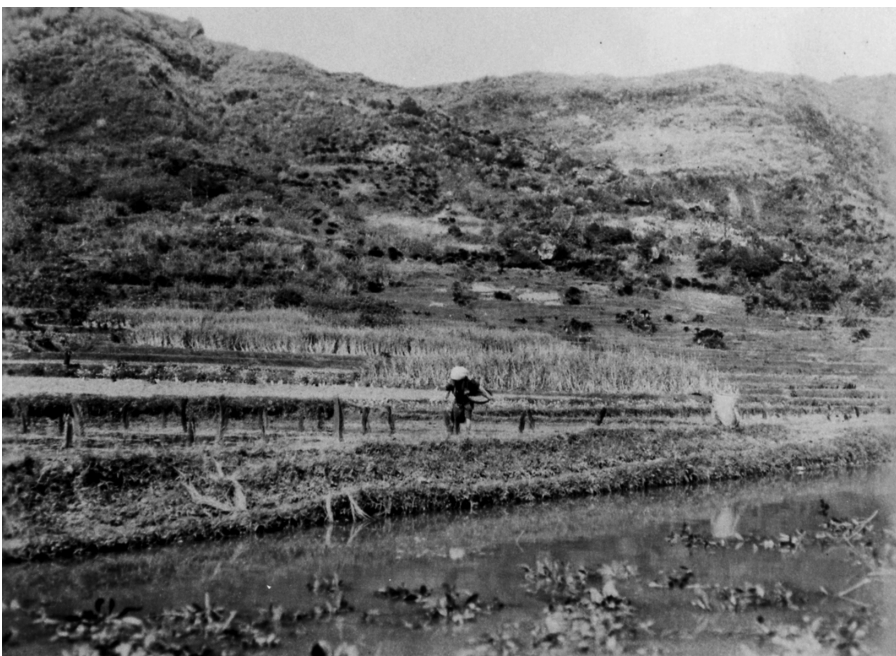
写真51 種下し 昭11.3.24 嘉鈍奥 川尻にて [目録番号：ア-8-26]