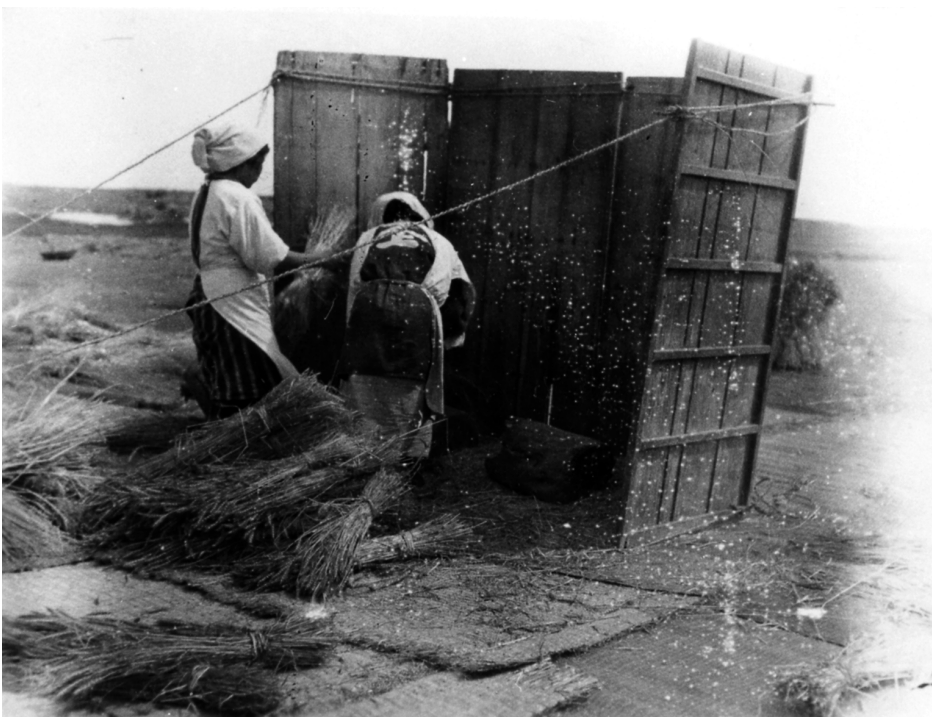
写真78 麦叩き（臼を横たえて 叩く）早町村志戸桶 昭11.5.7 [目録番号：ア-8-57]