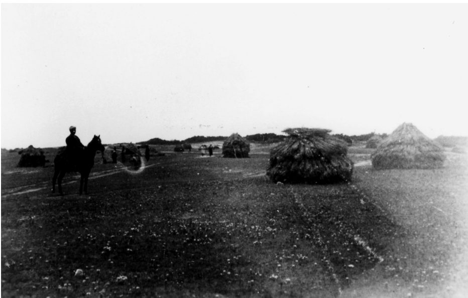
写真77 麦小積 荒木 11.5.2 [目録番号：ア-3-13]