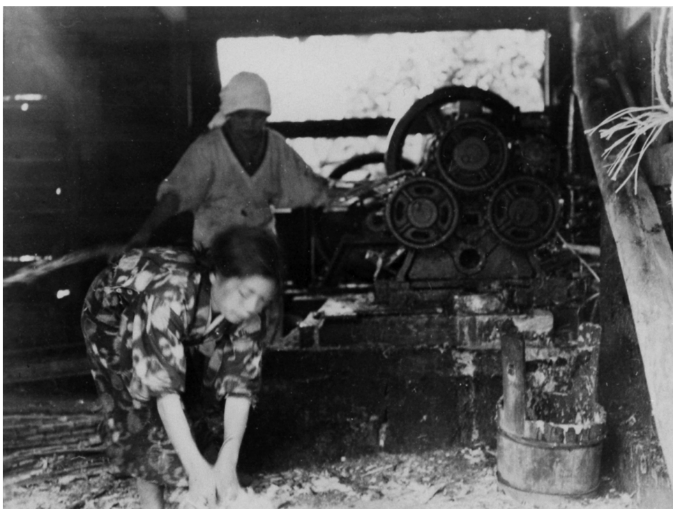
写真99 砂糖黍の圧搾機 (石油発動機) 於蒲生村 昭11.4 [目録番号：ア-8-10]