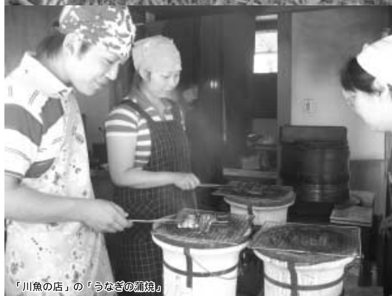
「川魚の店」の「うなぎの蒲焼」

置けられるようになった当然の結果でもあろう。かつての陳列・放任主義ではなく、博物館はそこに展示する「資料」の意味について、見る人たちに説明する義務を負うようになった。「資料」とは、ただそこにあるからといって資料になるものではなく、何らかの価値観が付加され、ひとつのストーリーの中に位置づけられるからこそ、資料となり得るからである。博物館はそれぞれの展示に責任を持って、一体そこで「何を伝えたいのか」という目的を設定し、来館者がそのことを少しでも理解しやすいように、さまざまな工夫を凝らすことが必要とされるようになってきたのである。