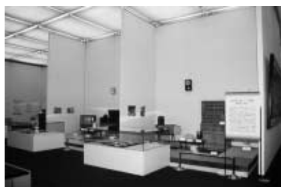
企画展「都市化の中の暮らし」