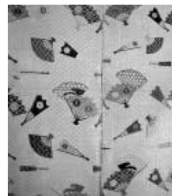
日本の能楽役者の服装に見られる扇紋。