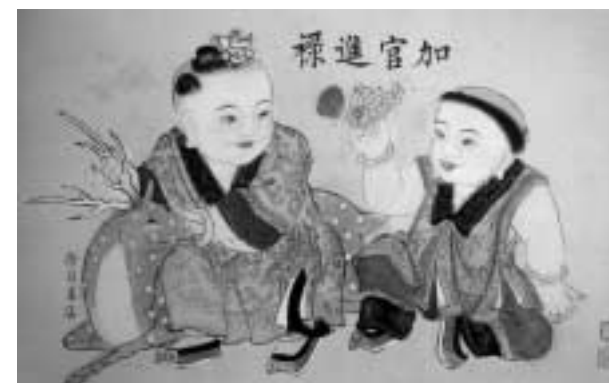
中国年画「加官進祿(官位が昇進し祿が上がる)」。右側の子供は冠をもち、「冠」で「官」を意味し、左側の子供は鹿に寄りかかり、「鹿」で「禄」を表す。その身に纏っている服装にも、菊、竹、盤長(中国結びのような紋様)の紋様が見られる。

日本では、日本特有の装飾紋様もかなり存在している。たとえば桜の花、扇、車輪などの紋様はこれである。扇は、中国の文化体系においても、日本の文化体系においても、あおいで暑気をおさめ、また火をおおる実用品としての効用のほか、芸術品ともみなされ、時には身分と品位の象徴にもなっている。しかし、日本のいくつかの芸術分野、たとえば能楽の演技の中では、扇はいつも必須の道具として脇に刺し、時々何らかのものを表しており、また招きや打撃、踊りなどの動作をする時の道具として使われている。これらの事例から、扇は日本の生活と芸術にとって欠かせない存在であることがわかる。それゆえ、人々に好まれていような装飾紋様で使われていると思われる。中国では、扇は縁起物としての象徴意味を持たず、中国の伝統吉祥図案の体系に入っていないのだ。(尹笑非氏は、2005年9月17日～9月30日訪問研究員として来日。)