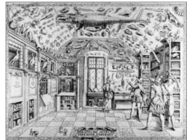
Ferrante Imperato's museum In Naples. Hooper-Greenhill, Eileen ' Museums and shaping knowledge (1992年) 127頁

博物館という場所は、一見、普遍的な知識の場所、記憶の場所として見えますが、実際、ある文化(ヨーロッパ)が生み出した特殊(パティキュラー)な記憶の回路の一つとして、位置づけられます。その特殊な記憶の回路が、植民地化、グローバル化、ヨーロッパ近代の生み出した普遍的志向の影響を受けて世界中に広まったと考えられます。博物館という場所は、一般に、外見的、静的なイメージが強いですが、実際には、集める、保存する、展示するという、積極的な人の行為がその深部に隠されています。今後、人類が発達させてきた記憶の場所、世界に広がる博物館を、静的、外観のイメージの場から解き放ち、ヨーロッパの文化が長く育んできた、人類の身体的記憶や集合的感性を映し出す場として、探求していきたいと思っています。