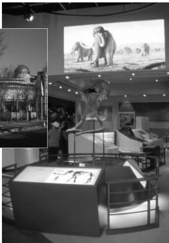
常設展示室（台地の生いたち）

これは計算してみれば明らかなことであるが、もぎりや経理担当者の人件費、券売機の設備費やメンテナンス費を考えると、100円や300円の入館料を徴収して、数100万円の収入を得るよりも、入館無料とした方が赤字額は軽減されるのである。もしも、受益者負担を原則として、観覧料を採算ベースに合わせようとしたならば、年間10万人以上の入館者がある相模原市立博物館でさえ、年間運営経費を3億円としても3,000円という驚異的な金額が算出されるのである。法的不備が前提にあるとはいえ、博物館は図書館・公民館と同じ社会教育機関なのであり、何よりも市民の学習権を保障する上で、利用は無料であるべきというのが正論であろう。