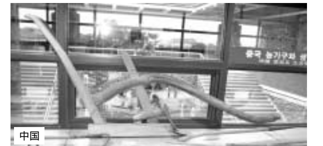
韓国犁は三角枠で無床犁、中国犁は四角枠で長床犁 (韓国 全羅南道農業博物館)