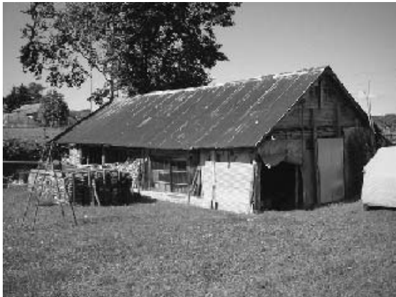
写真1 酪農以前の馬小屋 (2005.9.29 紋別市元紋別・筆者撮影)