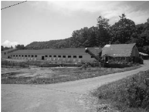
写真7 右側のブンカ屋根の牛舎に接ぎが行われる。規模の違いが対照的。 (2005. 7. 12 興部町豊野・)