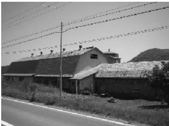
写真9 プンカ屋根同士の接ぎ(左方)と, 平屋の牛舎との接ぎ(右方)の両方を確認できる。 (2005. 7. 13 興部町秋里・)