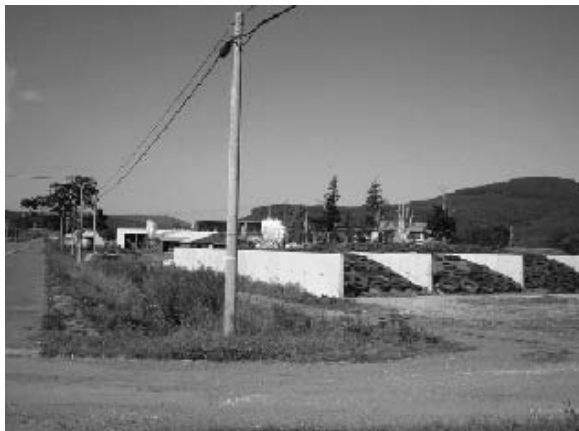
写真13 白く写るコンクリートの壁に挟まれる形で3基連続して設置されているものがバンカー。 (2005.9.29 紋別市藻別・)

くつか紹介してきた。それらを目にしたとき、そこにあることが当たり前で、何の違和感を感じないものにサイロや配合飼料のタンクがある。サイロは発酵飼料であるサイレージを作るための建物である。牛の飼い始めにはカンソウを主に与えており、発酵飼料を作るサイロは最初の牛舎建築当初からの所与のものではない。