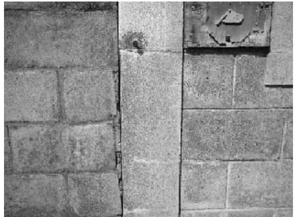
写真4 写真3-5白枠で囲んだ部分を拡大したもの。モノクロだとわかりにくいですが、色質に違いがある。積み方の違いから、作業を行った人が異なっていたこともわかる。