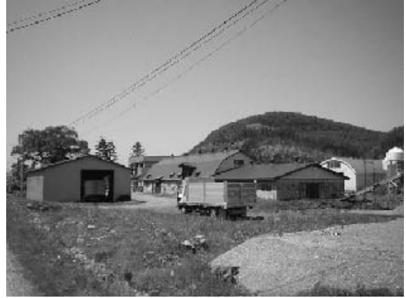
写真6 写真中央, プンカ屋根(奥側)に平屋の牛舎(手前)が接がれる。 (2005. 7. 13 興部町秋里・筆者撮影)