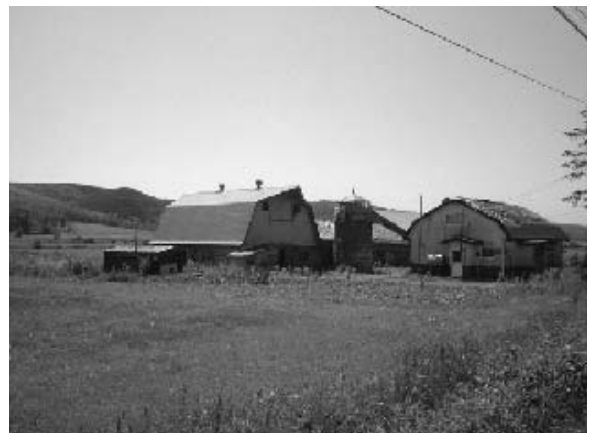
写真10 棟と垂直方向に接がれた事例。 (2005. 7. 13 興部町秋里・)