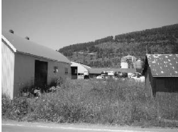
写真11 写真中央部、D型ハウスと平屋の牛舎が垂直に接がれている。 (2005.7.13 興部町秋里・筆者撮影)