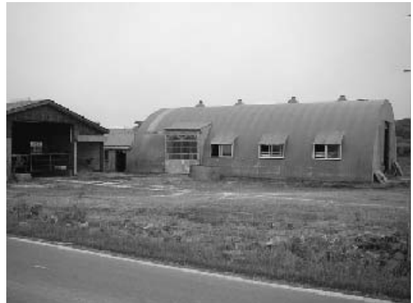
写真8 かまぼこ状の建物がD型ハウス。平屋の牛舎に接がれている。 (2005. 7. 12 興部町豊野・)