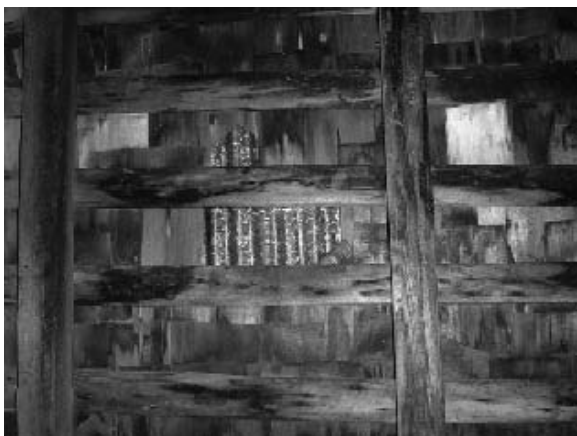
写真2 屋根材の重なり (2005.9.29 紋別市元紋別・筆者撮影)

写真1の馬小屋は掘立て、地盤沈下のため、建築当初よりもやや沈んでいる。その内部から屋根を写したものが、写真2になる。建築当初の屋根材である桎が見えるが、その破れ目からは上に被せたトタンを確認できる。写真1の馬小屋の間取りを示したものが、図2である。