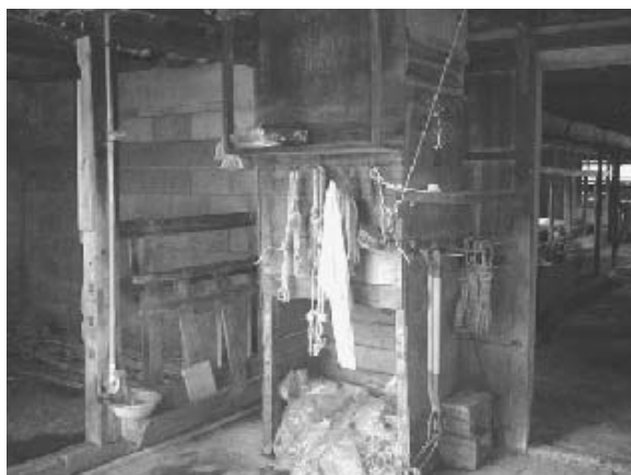
写真15 牛舎内部。左側が馬の区画。壁を挟んで右奥に牛の区画が続く。 (2005.7.18 紋別市沼の上・)