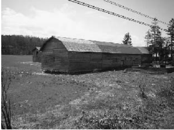
写真5 写真3と同じく同形を接ぐ事例。 (2005. 5. 16 興部町北興・筆者撮影)