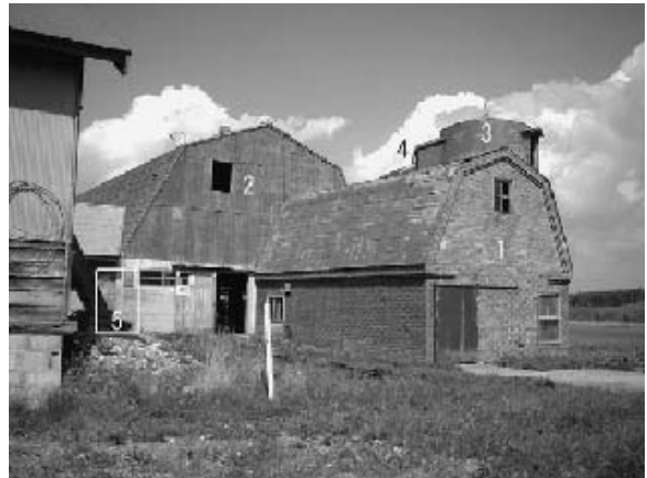
写真3 現前の畜舎景観（2005.7.18 紋別市沼の上・筆者撮影）

一つになる。写真にある姿は建築当初以来の姿ではない。ここでは、写真3に写る牛舎や付属施設が現前の姿に至る足跡をたどることを軸に、乳牛飼養の変化と畜舎景観の関係について検討する。