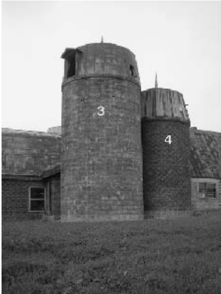
写真12 写真3のサイロを別角度から写したもの。写真中の番号は写真3中の番号を示す。 (2005.7.18 紋別市沼の上・)