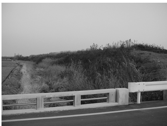
写真12 搦と江戸の境界となる干拓堤防