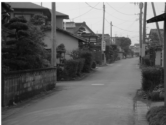
写真10 搦集落内の道路

集落外の道路、すなわち、農道については、搦集落の圃場整備もあって、両集落とも直線的であり、景観上の大きな差異はみられない。しかし、集落内の道路は塊村と列村という形態の違いから、多少異なる景観を示す。搦は細く狭い道路が不規則に交差しながら、集落内の各世帯を結んでいる（写真10）。一方、江戸の道路は写真4をみてもわかるように、集落内を一本のメインストリートが貫通し、そこに複数の農道が直交している。