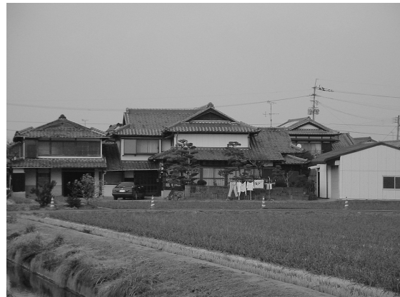
写真3 搦集落の家屋景観