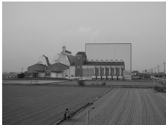
写真15 搦のカントリーエレベーター

続いて、農業関連の施設を比較してみよう。写真15は搦の南部に建設されたカントリーエレベーターである。圃場整備と同時に設置された。搦はもちろん、江戸も含めた近隣農村における米や麦などの穀物類を一手に扱っている。一方、写真16は江戸に設置されている排水機場である。両施設とも第二次世界大戦後の建造物であり、これらも近代農業を象徴する景観といえる。特に搦のカントリーエレベーターが圃場