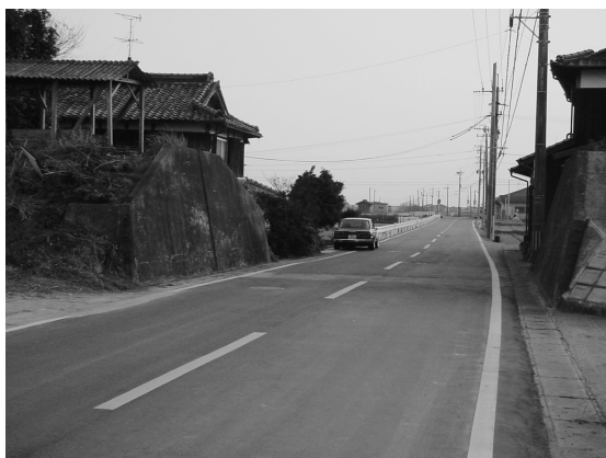
写真13 コンクリートで補強された干拓堤防