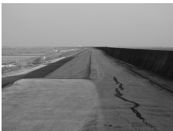
写真14 江戸最南端の干拓堤防