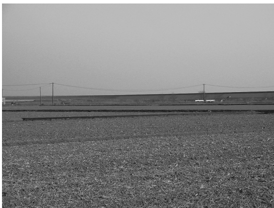
写真6 江戸の耕作地