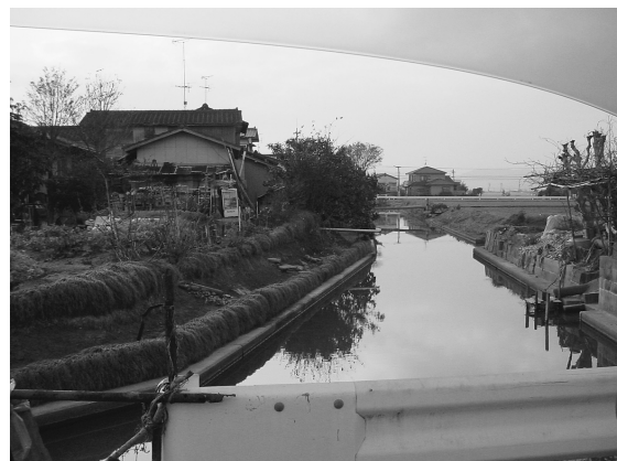
写真8 搦集落内を流れる水路