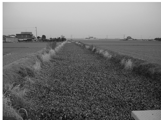
写真7 搦の農業用水路