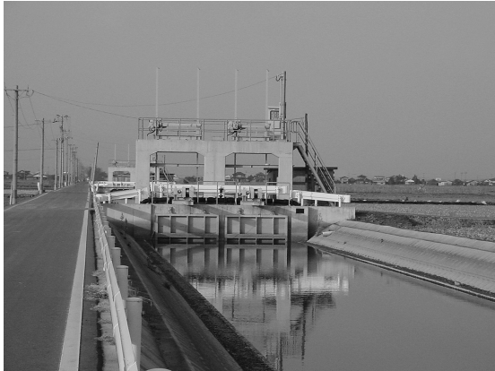
写真9 江戸の農業用水路と水門

一方、江戸の水路は、搦に比べて規模が大きい（写真9）。コンクリート製であることはもちろん、幅も広く、大型の水門が設置されている。搦の水路のように民家と隣接することはなく、完全に農業用水路としてのみの機能を有している。この水門は、まさに近代農業土木技術を象徴する景観といえよう。