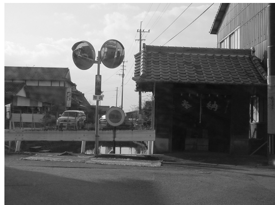
写真11 搦集落内の小祠

搦と江戸の両集落とも近隣の集落に立地する神社や寺院の氏子と檀家である。したがって、集落内に神社と寺院は立地していない。ただし、搦にはいくつかの小祠や石像が祭られている（写真11）。江戸には信仰の対象となるような地物はみられない。これは集落の成立時期とその契機の違いに起因しているのであろう。搦と江戸の景観には第二次世界大戦以前と以後という時代の影響が色濃く出ている。