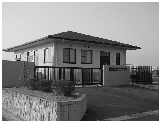
写真16 江戸に設置された排水機場