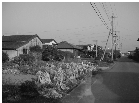
写真4 江戸集落の家屋景観